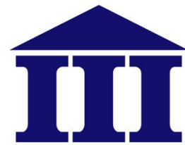
財團法人資訊工業策進會 INSTITUTE FOR INFORMATION INDUSTRY